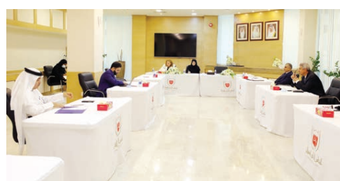
الغرفة، ومن جانبهم أشاد وفد غرفة تجارة وصناعة البحرين بما تحقق من إنجازات ملموسة على مستوى سرعة الفصل في الدعاوى، وتمكين الخدمات القضائية والعدلية الإلكترونية، وإنشاء هذه الفئات المستمرة ونأتي هذه اللقاءات المستمرة في إطار حرص المجلس الأعلى للقضاء على التواصل مع القطاع الخاص والإطلاع على رؤاه في مجال التطوير القضائي بما يسهم في تعزيز مزايا البيئة الاقتصادية والاستثمارية.

عقدت الأمانة العامة للمجلس الأعلى للقضاء اجتماعاً مع غرفة تجارة وصناعة البحرين، في إطار التواصل مع قطاع الأعمال، لبحث سبل تطوير الإجراءات القضائية. وتناول الاجتماع عدداً من الأفكار والمقترحات التطويرية المتعلقة بإجراءات تنفيذ الأحكام القضائية، وزيادة المحاكم المختصة، وتفعيل الوسائل البديلة لتسوية المنازعات من خلال الوساطة والتحكيم، وتعزيز برامج العدالة الرقمية في المحاكم وسبل التعاون بين المجلس