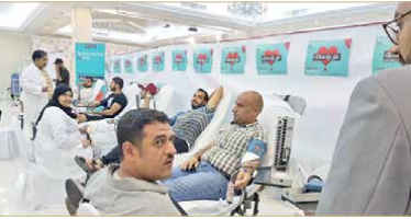
مديرين ضمن حملة الإمام زين العابدين صورة أرشيفية

ثقافة التبرع بالدم بين المواطنين والمقيمين على حد سواء، وترسيخاً للهدف الإنساني النبيل في مجال البذل والعطاء، وأسماها بالجمعية المجتمعية وتقدمت بطلب من وزارة الصحة والشراكة المجتمعية بينها وبين جميع