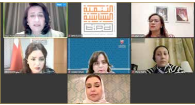
المشاركين بفعالية معهد التنمية السياسية

على مستوى العالم تتولى هذا المنصب. وتحدثت الشيخة هيا بنت راشد لتختصر موضوع الندوة بالقول: "قبل أن أستلم مهمتي كرئيسة للجمعية العامة قال لي الأمين العام الأسبق الراحل كوفي عنان: لابد من اختيار فريق قوي، فريق العمل إذا كان لا يعرف مواطن الأمور سوف يغرق! واستفدت من هذه النصيحة، وهي نصيحة لكل دبلوماسي أن يكون لديه فريق عمل قوي ولا يخاف منه بل يخاف عليه ليقدم له النصيحة الصادقة. خذه أو تركه واستطردت في شرح نقاط عديدة منها أننا نحن البشر، لدينا كثير من الأمور التي نتحدث عنها ونواجه الأخطار التي تحيط بالبشرية، لذلك، قانديبلوماسية في أهم وسائل ذلك التواصل، وتسوق مثلاً: تحدثت مع رئيس مجموعة دولية بشأن موضوع نظرحه للمناقشة، فقلت