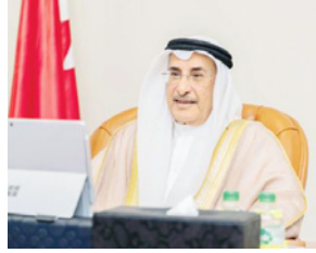
نائب رئيس مجلس الوزراء

البحراني: آلية جديدة لدعم هئية الكهراء المواطنين بالمسكن الأول في 2022