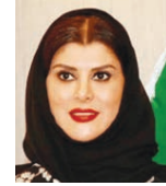
○ الأميرة دعاء بنت محمد.

عزت الرئيس الأعلى لمنظمة المرأة العربية بالملكة العربية السعودية إلى النظام التعليمي، وخصوصاً الأطفال في مرحلتها رياض الأطفال والمرحلة الابتدائية، مشددة على وجود انعكاسات سلبية على العملية التعليمية جراء الجائحة، مشددة على حاجة الطلبة وخصوصاً في المراحل المتقدمة إلى اللعب والأنشطة السليمة والجماعية، مشددة على أهمية التواصل الاجتماعي في تنشئة الأطفال وتنمية شخصياتهم.