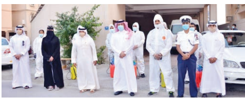
المشاركين والمتطوعين من الجسنيين في جميع الحملات التي تهدف إلى تعقيم كافة المرافق

ومن ضمنها المساجد والأسواق والمجمعات التجارية. وقد قام نائب المحافظ الشكر والتقدير إلى مدير عام وجميع منتسبي الإدارة العامة للدفاع المدني بوزارة الداخلية على جهودهم في تقديم الدعم والمساندة والتدريب لجميع المتطوعين، مشيداً بفرق البحرين تستأهل التطوع على دورهم الفعّال وتعاونهم الدائم لما من شأنه تحقيق المصلحة العامة.