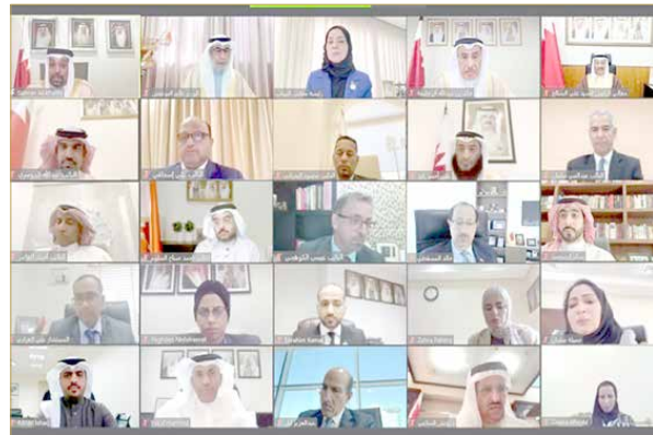
السلطان التشريعية والتنفيذية يعقدان اجتماعاً مشتركاً لبحث ومناقشة مشروع ميزانية 2021 - 2022

عقدت السلطان التشريعية والتنفيذية صباح أمس بواسطة تقنية الاتصال المرئي بعد الاجتماع المشترك الأول لبحث ومناقشة مشروع قانون اعتماد الميزانية العامة للدولة للسنتين 2021 و2022. وأشار نائب رئيس مجلس الوزراء ورئيس اللجنة الوزارية للشؤون المالية والاقتصادية والتوازن المالي الشيخ خالد بن عبدالله آل خليفة إلى أن الميزانية ارتكزت على أسس مهمة منها استمرار الالتزام بتحقيق أهداف برنامج التوازن المالي، إلى جانب العمل على تحفيز التعافي الاقتصادي في المرحلة المقبلة والاستمرار في خلق الفرص الواعدة للمواطنين وقدرت زيادة الإيرادات غير النفطية للسنة المالية 2021 بنسبة 38% بمقدار 878 مليون دينار و39% للسنة المالية 2022 بمقدار 916 مليون دينار. (03)