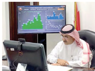
النائب العام يشارك في الورشة الافتراضية

عنه من اتفاق تسوية، بعد التثبت من استيفائه الشروط والضوابط القانونية وعدم مخالفته النظام العام. وأوضح النائب العام أن الغرض من تنظيم النيابة العامة هذه الورشة هو طرح فكرة واضحة وملئة عن الوساطة ومكتمها، وبيان مفضل لإجراءاتها، وآرها القانوني على الدعوى الجنائية، واستشراف أثر ذلك على المجتمع ومدى ثقائه بمصالحه، وصولاً من ذلك إلى فهم كامل وتطبيق سديد للوساطة الجنائية.