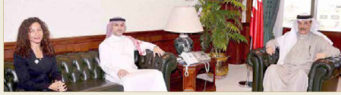
حميديان ملتقى بوخوة

◆ حميديان لرئيس "ستاندرد تشارترد بنك": ضرورة المحافظة عليهم