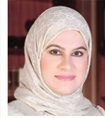
○، فرزاة المراعي.

المراعي: نسبة الطلبة المسجلين من الجامعات لم تتجاوز ٣٥٪