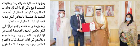
العامّة - وزارة الخارجية

حضر وزير الخارجية عبد اللطيف الزياني، اللقاء الذي نظّمته الوزارة أمس في الديوان العام، بحضور مساعد وزير الخارجية ووكلاء الوزارة والوكلاء المساعدين ومدبري الإدارات ورؤساء الأقسام، وذلك بمناسبة حصول الموظفين والمقيمين والخدمات القفصية على شهادة الأيزو 9001:2015 بالتعاون مع شركة بيرو فيتاس، وحصول إدارة نظم المعلومات على شهادة الأيزو في أمن المعلومات 27001:2013، بالتعاون مع شركة TÜV.