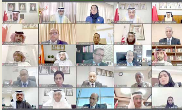
السلطان التشريعية والتنفيذية تعان اجتماعاً مشتركاً لبحث وصياغة مشروع ميزانية 2021 - 2022

ولي العهد رئيس الوزراء صاحب السمو الملكي الأمير سلمان بن حمد آل خليفة، إلى رئيسي وأعضاء مجلسي الشورى والنواب، تقديرًا للدور الذي تضطلع به السلطة التشريعية. وأوضح أن بناء الميزانية العامة للدولة للسنتين الماليتين 2021-2022 وضع المواطن محوراً أساسياً عبر ما تم مراعاته من مبادئ عند صياغة مشروع الميزانية، مؤكداً بأن هذه المبادئ تركز على مواصلة الحفاظ على الدعم الاجتماعي للمواطنين الأكثر احتياجاً، إلى جانب الاستمرار في تحسين كفاءة الخدمات الحكومية والعمل على زيادة إنتاجيتها وتطويرها، منها بأن الحكومة بدأت بنفسها من خلال خفض المصروفات الإدارية وتعزيز كفاءة الإنفاق الحكومي والاستخدام الأمثل للموارد المالية، كما لفت إلى أن الميزانية ارتكزت على أسس مهمة منها استمرار الالتزام بتحقيق أهداف برنامج التوازن المالي، وبالأخص زيادة الإيرادات غير النفطية مع الالتزام بسقف المصروفات وذلك حسب الخطة الموضوعة لذلك، إلى جانب العمل على تخفيض التعافي الاقتصادي خلال المرحلة المقبلة والاستمرار في خلق الفرص الواعدة للمواطنين. وأشد التطلع للمستمر بين السلطين التنفيذية والتشريعية والذي يضع نصب عينه تحقيق كل الخير والنماء للوطن والمواطن، معرباً عن أمه في مواصلة تعزيز هذا التعاون من خلال مزيد من التوافق لتلبية تطلعات المواطنين، مع الأخذ بعين الاعتبار التحديات الماثلة جراء انخفاض أسعار النفط والأسواق العالمية والظروف الراهنة لجائحة فيروس كورونا. وأكد خلال الاجتماع حرص الحكومة على أن يكون التعاون والتوافق السمة الغالبة على أجواء الاجتماعات التي سيتم خلالها بحث مشروع الميزانية،